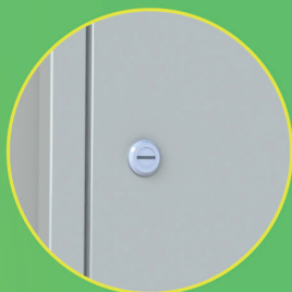
FECHO METÁLICO TIPO FENDA OU PORTA CADEADO