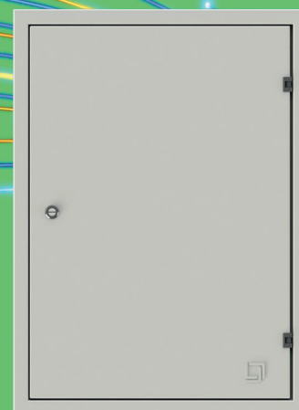
PORTA E MOLDURA P170 - 66M (03 ETAPA) ACABAMENTO FINAL

Nos acompanhe pelas nossas Redes Sociais