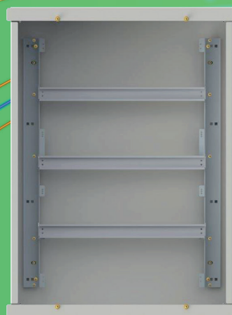
CHASSI P170-66M (02 ETAPA) LIGAÇÃO DOS CABOS NOS COMPONENTES