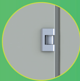
DOBRADIÇA METÁLICA EMBUTIDA, PRETA OU CROMADA