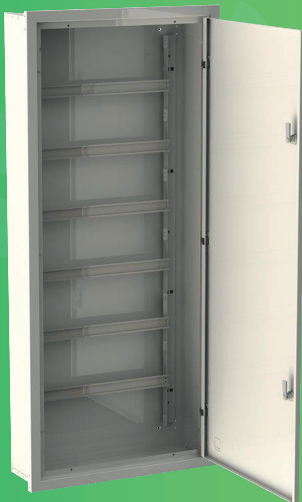
VISTA INTERNA P170-132M

☐ Cor de acabamento: Pintura eletrostática, Cinza claro ral 7035.